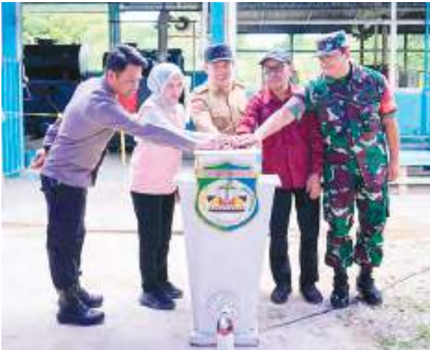
BUPATI Morowali Iksan Baharuddin Abdul Rauf menghadiri peresmian peningkatan jam operasi pembangkit listrik tenaga diesel di Pulau Paku, Kecamatan Bungku Selatan, Selasa (26/5/2026).