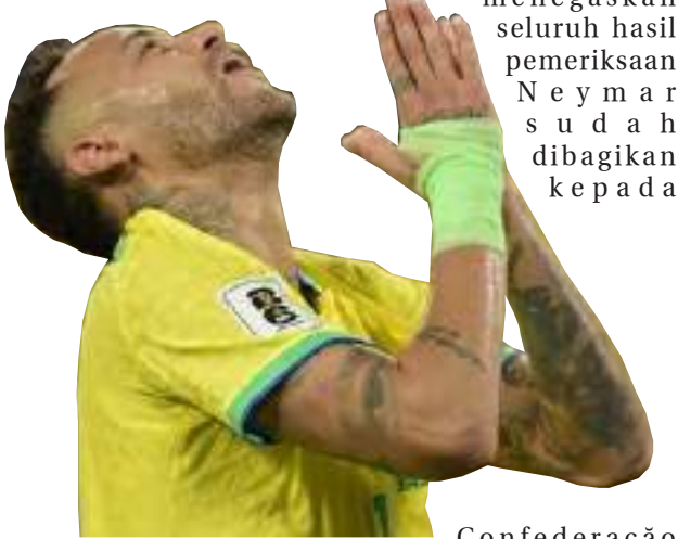
Confederação Brasileira de Futebol (CBF) sejak 18 Mei.

Menanggapi isu tersebut, Santos langsung mengeluarkan pernyataan resmi. Klub menegaskan seluruh hasil pemeriksaan Neymar sudah dibagikan kepada