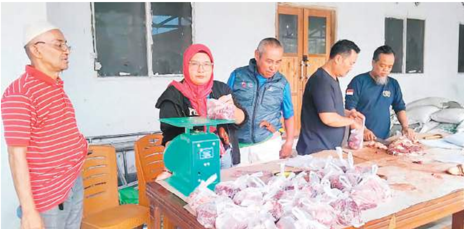
DAGING kurban dikemas dalam bungkus untuk dibagikan ke karyawan dan panti asuhan.

PALU, MERCUSUAR – Trimedia Grup yang menaungi Harian Mercusuar, Sulteng Raya, serta sejumlah media lainnya melaksanakan penyembelihan empat ekor sapi kurban dalam rangka Hari Raya Iduladha 1447 Hijriah, Jumat (29/5/2026). Penyembelihan dilakukan di halaman kantor percetakan Trimedia Grup dengan melibatkan karyawan.