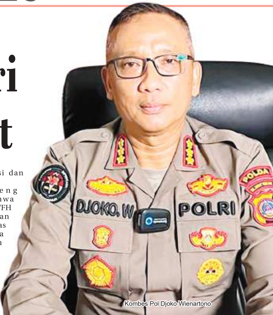
Kombes Pol Djoko Wienartono

tugas administrasi dan pelayanan publik. Polda Sulteng menegaskan bahwa perubahan jadwal WFH tersebut tidak akan mengurangi kualitas pelayanan kepada masyarakat. Seluruh satuan kerja diminta tetap memastikan pelaksanaan tugas berjalan efektif, responsif, dan profesional sesuai ketentuan yang berlaku.