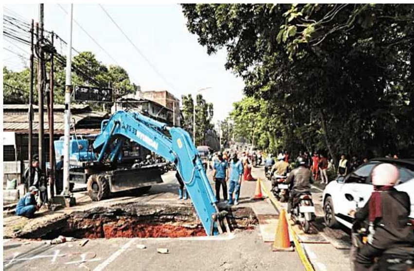
PERBAIKAN: Perbaikan jalan ambles di Jalan Raya Lenteng Agung, Jagakarsa, Jakarta Selatan, Jumat (29/5). Dinas SDA DKI Jakarta mengerahkan alat berat untuk menangani kerusakan jalan yang diduga dipicu saluran air di bawah badan jalan yang kopong. Sementara itu, arus lalu lintas di kawasan tersebut masih mengalami kepadatan dan diberlakukan rekayasa lalu lintas selama proses perbaikan berlangsung. (Poskota/CR-4)