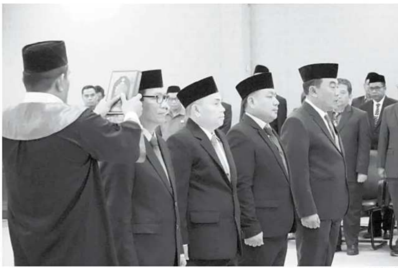
Pelantikan sejumlah pejabat eselon II Pandeglang dalam agenda rotasi jabatan oleh Bupati Pandeglang.

Pemkot Tangerang berharap pembangunan crossing drainase tersebut dapat segera direalisasikan guna mencegah banjir di kawasan akses menuju Bandara Internasional Soekarno-Hatta, terutama saat intensitas hujan tinggi. (tog)