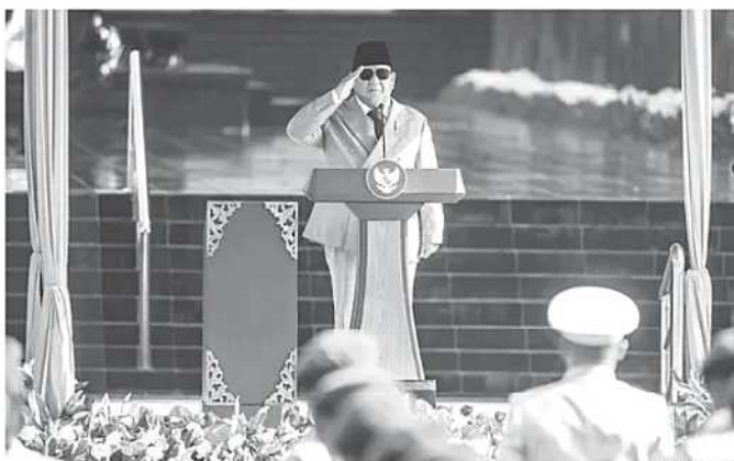
Presiden Prabowo Subianto memimpin upacara peringatan Hari Kesaktian Pancasila di Monumen Pancasila Sakti, Lubang Buaya, Jakarta.