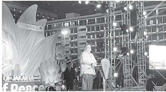
WASAK - Wakil Gubernur Rano Karno memberikan sambutan di Perayaan Waisak 2570 BE/2026 bertajuk Illumination of Jakarta: Glow of Peace di kawasan Bundaran HI, Jakarta Pusat, Jumat (29/5/2026).

Sudin PKKP Jakarta Timur juga mengimbau panitia hewan kurban dan masyarakat agar tetap memperhatikan kebersihan lokasi pemotongan serta memastikan proses distribusi daging dilakukan secara higienis guna mencegah penyebaran penyakit dari hewan ke manusia. (den)