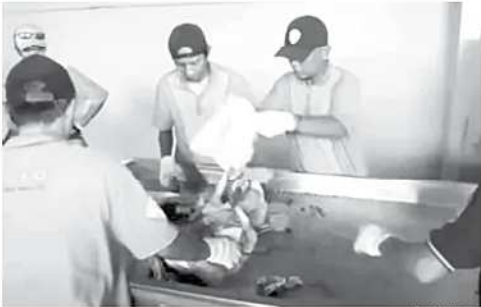
Petugas TPS 03 saat melakukan pemilahan sampah.