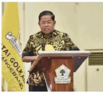
Wakil Ketua Umum Partai Golkar Idrus Marham.

"Indonesia sedang dipimpin oleh seorang patriot yang tahu persis bagaimana cara memenangkan kepentingan nasional di luar negeri. Menilai keberhasilan diplomasi internasional dari hasil beberapa minggu atau bulan adalah cara berpikir yang tidak logis," kata Sugiat. (rub)