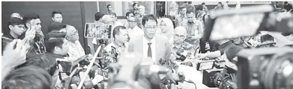
Menteri Keuangan Purbaya Yudhisastra saat memberikan keterangan kepada awak media dalam suatu acara beberapa waktu lalu.