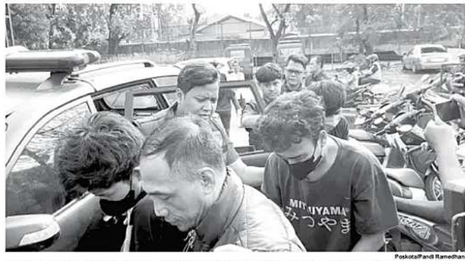
CURANMOR - Tiga pelaku pencurian dengan kekerasan (curas) ditangkap Unit Reskrim Polsek Cengkareng setelah beberapa kali berlari di wilayah Jakarta Barat.

Latiful menyebutkan, hasil tangkapan di wilayah Lubang Buaya mencapai sekitar 3,7 kilogram dengan metode penangkapan menggunakan jaring. "Untuk penanganannya, ikan sapu-sapu ini dimatikan terlebih dahulu sebelum dikubur," tandasnya. (den)