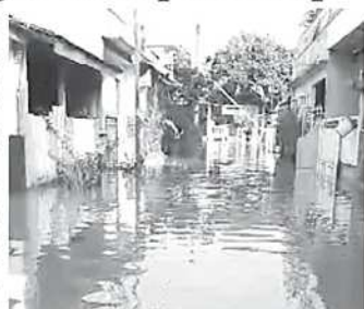
Beginilah kondisi rumah yang terendam banjir di Perumahan BSI, Duren Mekar, Bojongsari.

Salah satu upaya yang akan diusulkan ialah pembangunan kolam penampung air atau embung di sekitar kawasan permukiman warga yang kerap