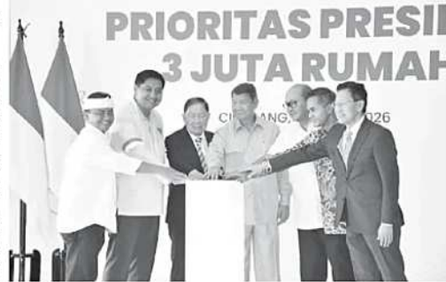
Pemerintah memulai pembangunan rumah susun (rusun) subsidi di kawasan Meikarta, Kabupaten Bekasi, sebagai bagian dari percepatan Program 3 Juta Rumah yang dicanangkan Presiden Prabowo Subianto.

Selain aspek lokasi dan tata ruang, yang membuat proyek ini layak menjadi percontohan adalah adanya sinergi antara pemerintah dan sektor swasta. Selama ini, pembangunan rumah subsidi umumnya dilakukan nasional, skema rumah tapak yang tersebar di berbagai daerah. Namun, pembangunan rusun subsidi memerlukan investasi yang lebih besar, pengelolaan yang lebih kompleks, serta dukungan infrastruktur yang memadai. Keterlibatan