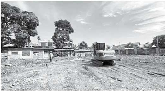
Pembangunan jalur baru pengganti Jalan Saleh Danasasmita, Batutulis, Kota Bogor, mulai dikerjakan.

Akibat kejadian tersebut, korban mengalami kerugian berupa telepon genggam dan uang tunai yang berada di dalam dompet. (den)