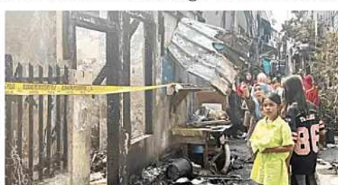
PUNG: Warga melintas di antara puing-puing rumah yang hangus terbakar di kawasan permukiman padat Krendang, Tambora, Jakarta Barat, Jumat (29/5). Kebakaran yang diduga dipicu korsleting listrik itu melalap 27 rumah dan memaksa ratusan warga mengungsi ke tempat penampungan sementara.