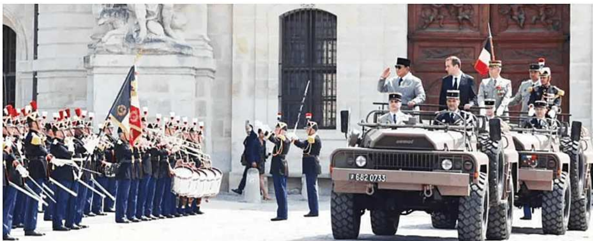
KUNJUNGAN - Presiden Republik Indonesia Prabowo Subianto menghadiri upacara kenegaraan di Les Invalides, Paris, Kamis (28/5), dalam rangka kunjungan resmi kenegaraan di Republik Prancis. Presiden Prabowo disambut langsung oleh Perdana Menteri (PM) Prancis, Sébastien Lecornu. Presiden Prabowo selanjutnya memberikan penghormatan kepada bendera dalam prosesi yang berlangsung khidmat, diiringi dengan pengumandangan lagu kebangsaan Indonesia, lagu kebangsaan Prancis, La Marseillaise.