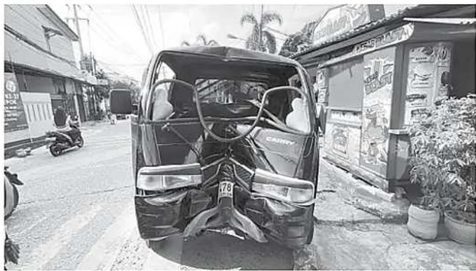
Mobil pikap Suzuki Carry ringsek setelah menabrak tiang listrik di Jalan Haji Dimun Raya, Cilodong, Kota Depok, Jawa Barat, Kamis, 28 Mei 2026.

Dalam kejadian tersebut, satu orang mengalami luka bakar sekitar 30 persen dan telah dilarikan ke rumah sakit terdekat untuk mendapatkan penanganan medis. (den)