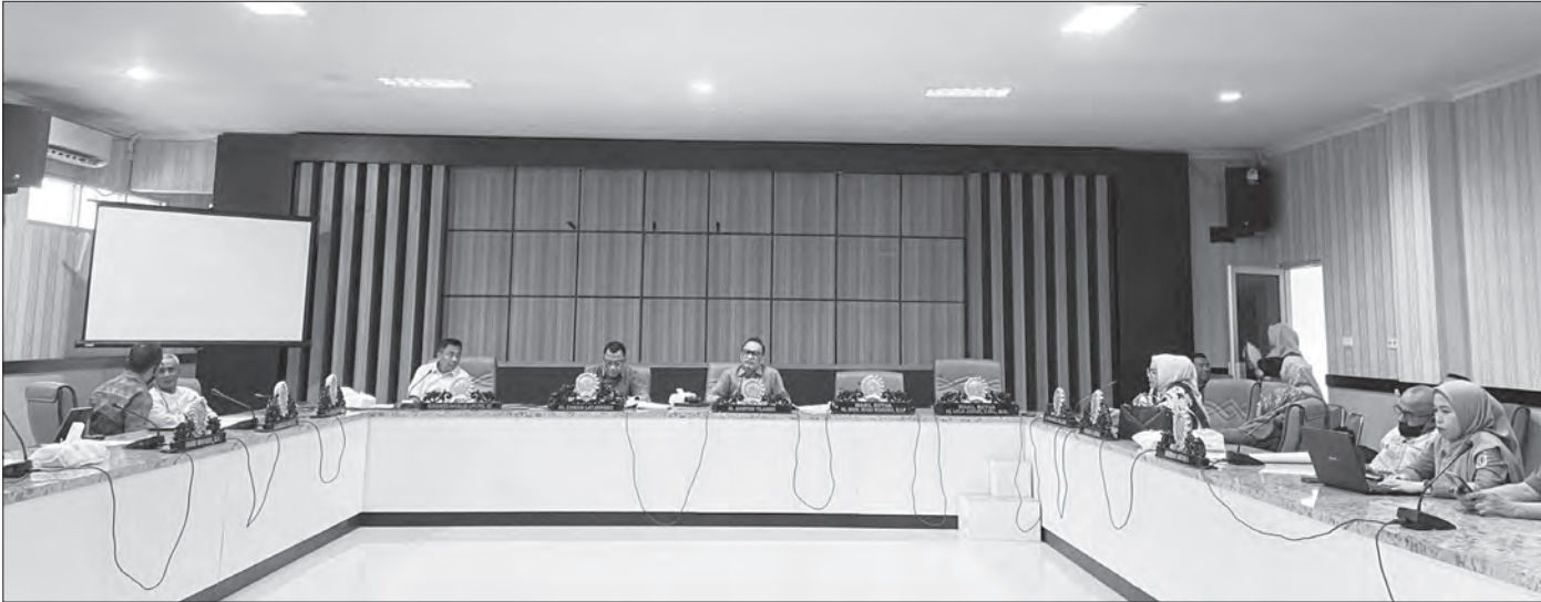
Dokumentasi rapat Dekot yang digelar di Aula III.