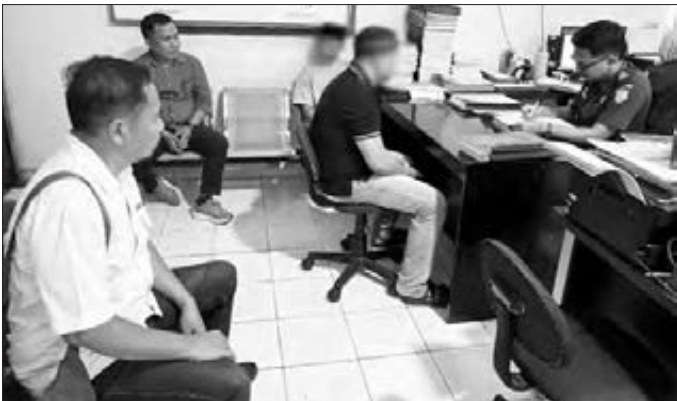
Dua tersangka PETI Buntulia saat diserahkan penyidik Satreskrim Polres Pohuwato ke Kejari, Rabu (3/6/2026).

GORONTALO - GP- Dua tersangka kasus dugaan Pertambangan Emas Tanpa Izin (PETI) nampaknya sudah tak lama lagi diadili di lembaga peradilan. Ini setelah keduanya diserahkan penyidik Satuan Reserse Kriminal (Satreskrim)