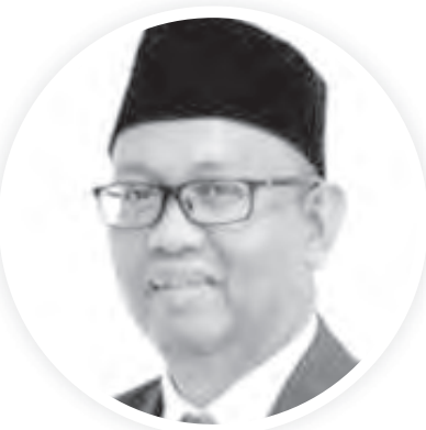
Oleh : Muh. Amier Arham

Kritik dari LPEM FEB UI valid secara akademik, sebab dalam statistik makro ekonomi penting melihat konsistensi lintas sektor dan lintas indikator. Walaupun demikian patut kita cermati, agar tidak terlalu cepat menyimpulkan