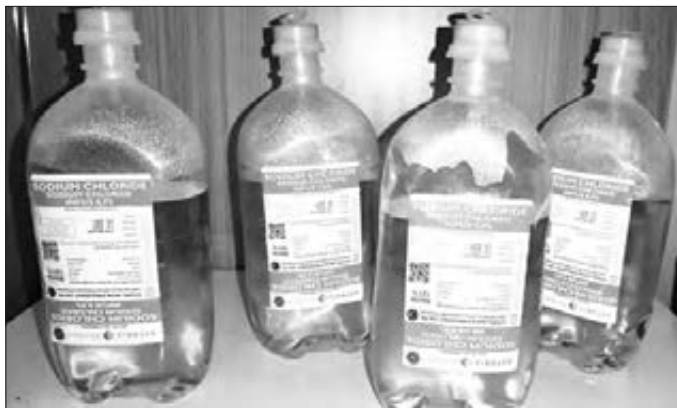
Cairan NaCl yang saat ini stoknya kosong di semua apotek yang ada di Gorontalo

Seperti diketahui, cairan Natrium klorida NaCl atau saline adalah larutan garam yang memiliki banyak fungsi. Cairan ini dapat digunakan sebagai pembersih luka, pembilas hidung, pengencer dahak, atau obat kumur untuk menjaga kebersihan mulut. Berdasarkan konsentrasi larutannya, natrium klorida (NaCl) dibagi menjadi NaCl isotonik dan hipertonik. Natrium klorida isotonik memiliki konsentrasi garam yang sama dengan cairan tubuh manusia. NaCl jenis ini biasanya digunakan untuk mengganti cairan tubuh, membersihkan luka, dan membersihkan hidung. Yang lebih penting lagi NaCl digunakan sebagai bahan utama untuk Tindakan operasi terhadap pasien. (roy)