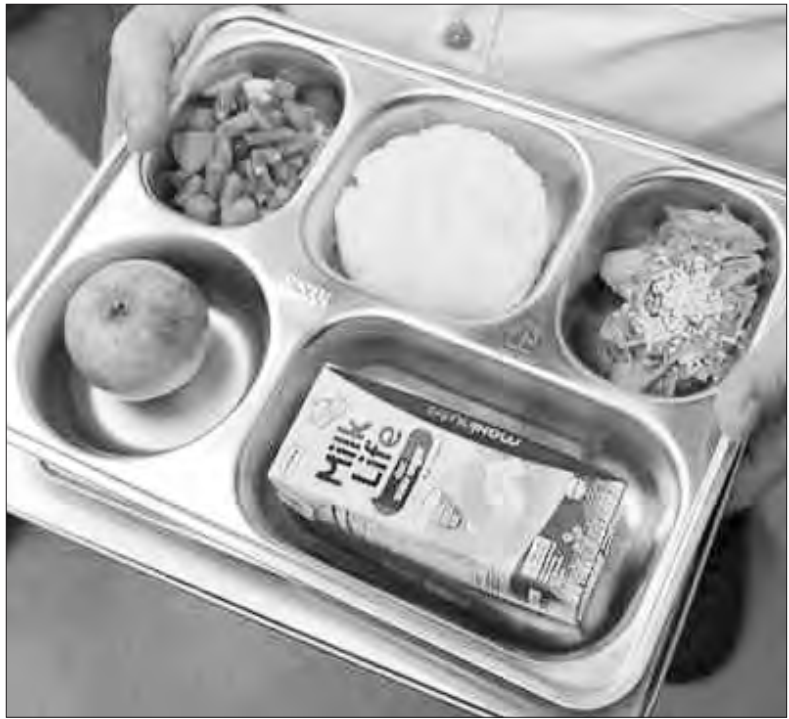
Salah satu menu Makan Bergizi Gratis yang dilengkapi susu.

JAKARTA - Badan Gizi Nasional (BGN) mengakui kewalahan dalam memenuhi kebutuhan susu untuk program Makan Bergizi Gratis (MBG). Menurut Pelaksana Tugas (Plt). Deputi Bidang Promosi dan Kerja Sama BGN, Gunalan, saat ini terdapat 29.670 dapur Satuan Pelayanan Pemenuhan Gizi (SPPG) yang beroperasi. Sementara penerima manfaat MBG mencapai 63 juta. Dengan aturan setiap SPPG wajib memberikan susu sebanyak dua kali dalam seminggu, membuat kebutuhan pasokan susu nasional meningkat tajam. Sementara, jumlah pasokan susu dalam negeri dinilai belum mampu mengimbangi kebutuhan tersebut.