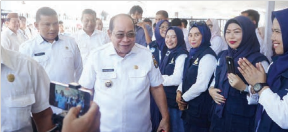
Suasana kegiatan silaturahmi yang diselenggarakan Pemerintah Kota Gorontalo dengan warga Kelurahan Talumolo, Kecamatan Dumbo Raya, Senin (1/6/2026) malam.