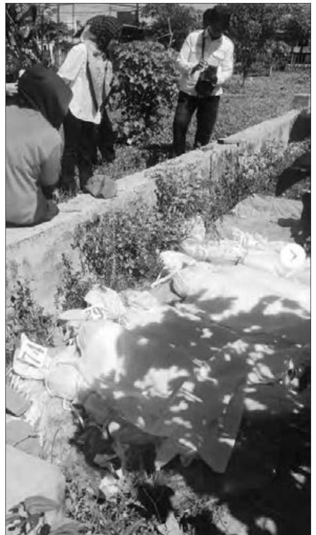
Sejumlah jenazah yang telah dikeluarkan dari dalam kuburan sudah dibungkus kain kafan akan dipindahkan ke makam baru belakang kantor camat Sipatana, Kota Gorontalo, Rabu, (3/6/2026).

Namun, hingga hari H pemindahan makam, tidak ada informasi mengenai keberadaan ahli waris. "Jadi jenazah itu dipindahkan ke makam baru di Belakang kantor Camat Sipatana," kata Kasim. Sebelumnya bulan lalu, satu makam sudah dipindahkan pihak ahli waris atau keluarganya ke daerah Buol. Sehingga total makam yang sudah dipindahkan sebanyak sepuluh makam. Saat ini terisa 43 makam lagi yang akan dipindahkan. Langkah ini menjadi bagian dari penataan kawasan yang akan dialihfungsikan sebagai pusat perkantoran pemerintah daerah Kota Gorontalo. (roy)