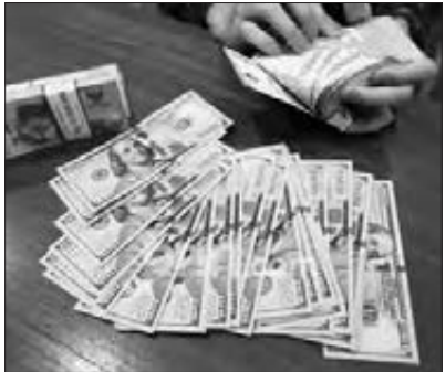
Nilai tukar rupiah terhadap dolar AS ditutup melemah signifikan pada penutupan perdagangan Rabu (3/6) sore.

surplus perdagangan tersebut terlihat menyempit tajam. “Menggarisbawahi tekanan pada daya beli dan ketahanan eksternal akibat pasokan global yang tersendat akibat selat Hormuz di blokade,” tuturnya. Pada kesempatan tersebut, Ibrahim juga menyoroti masalah kebocoran dana di tubuh Badan Gizi Nasional yang turut menjadi sentimen negatif. Terkini, Presiden Prabowo Subianto diketahui mencopot Dadan Hindayana sebagai kepala BGN, dan Kejaksaan Agung langsung menangkapnya lantaran diduga ada korupsi. Namun, Ibrahim menekankan perubahan kepala BGN tidak akan mempengaruhi sentimen rupiah menjadi positif. “BGN mau gonta-ganti seratus kali ketuanya juga tetap membuat rupiah melemah,” ujarnya. (jppn)