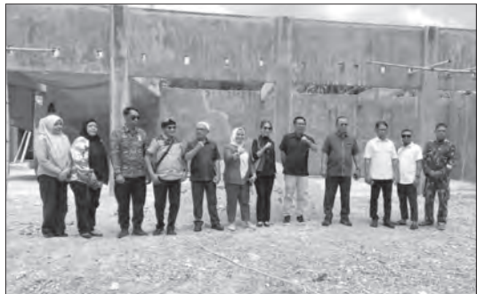
KUNJUNGAN Komisi I Deprov Gorontalo ke desa Alale, Kecamatan Suwawa Tengah, Bone Bolango, Selasa (2/6).

Komisi I DPRD Provinsi Gorontalo juga berharap keberadaan Koperasi Desa Merah Putih di Desa Alale nantinya mampu memperkuat pemberdayaan masyarakat, membuka peluang usaha baru, serta meningkatkan kesejahteraan warga melalui pengelolaan koperasi yang profesional dan berkelanjutan. Program ini diharapkan menjadi contoh pengembangan ekonomi kerakyatan yang sukses di Kabupaten Bone Bolango maupun di Provinsi Gorontalo. (rmb)