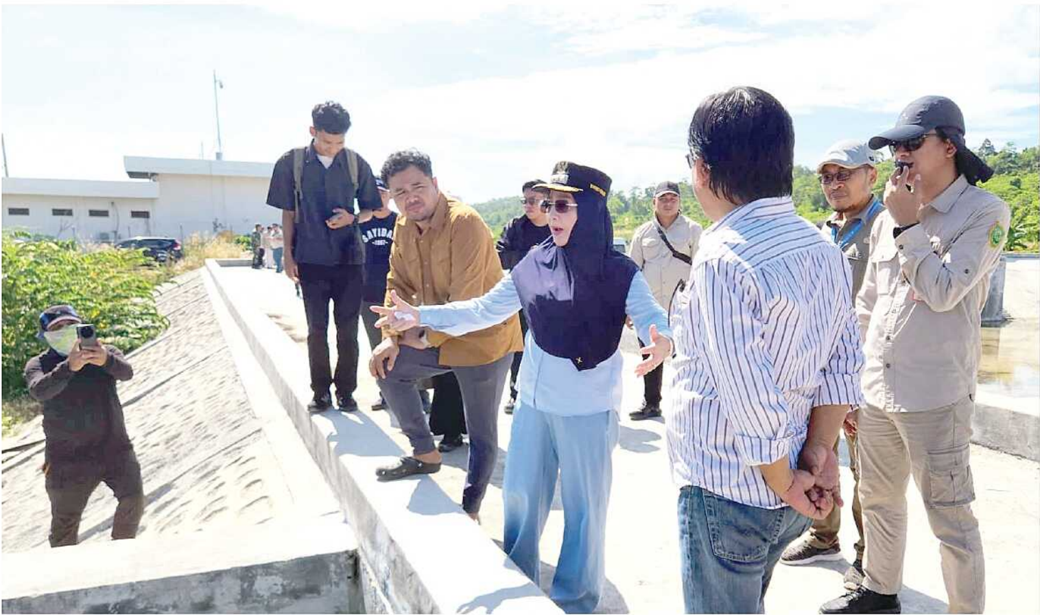
TERTUNDA. Embung air bersih di Kampung Payung-Payung, Kecamatan Maratua, belum dapat dioperasikan tahun ini akibat keterbatasan anggaran untuk pembangunan fasilitas pendukung.

Pemanfaatan embung di Kampung Payung-Payung kembali tertunda. Pemerintah masih membutuhkan anggaran hingga Rp25 miliar untuk melengkapi sistem pendukung agar fasilitas tersebut dapat berfungsi optimal.