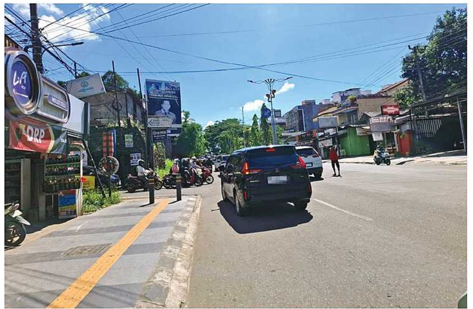
PERLU PELEBARAN. Simpang Jalan Anggur menjadi salah satu titik yang direkomendasikan untuk diperlebar guna mengurangi penumpukan kendaraan pada jam-jam sibuk.

"Segmen Jalan Anggur relatif sempit. Karena itu, yang lebih memungkinkan adalah pelebaran muara simpang agar kendaraan yang keluar maupun masuk Jalan Anggur bisa bermanuver lebih leluasa. Dengan begitu, potensi penumpukan kendaraan dapat diminimalkan," pungkasnya. (rin/beb)