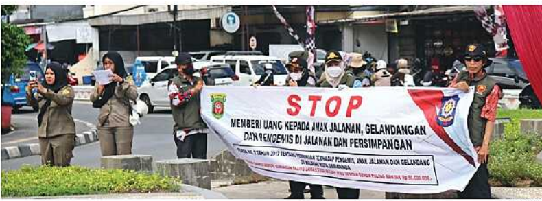
SOSIALISASI PERDA. Personel Satpol PP Samarinda membentangkan spanduk dan membagikan leaflet kepada pengguna jalan dalam sosialisasi larangan memberi uang kepada pengemis, pengamen, dan anak jalanan di sejumlah persimpangan kota.

Menurut Anis, kebiasaan memberi uang secara langsung di jalan justru menjadi salah satu faktor yang membuat aktivitas mengemis dan praktik serupa terus bertahan. Selain mengganggu ketertiban umum, aktivitas tersebut juga berpotensi membahay-