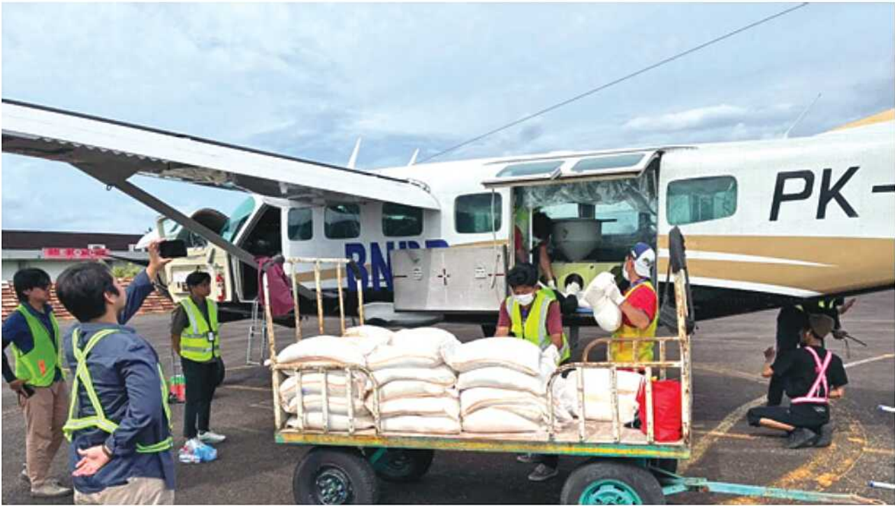
SIAGA. BNPb melaksanakan OMC di Jambi sampai 12 Juni mendatang. Tujuannya untuk mencegah terjadinya karhutla.

garam sebanyak satu ton di awan yang berpotensi tumbuh menjadi awan hujan. "OMC berlangsung di sekitar wilayah Kabupaten Tanjung Jabung Barat, Tanjung Jabung Timur dan Muaro Jambi. Pascaoperasi, hujan terjadi di wilayah Tanjung Jabung Barat dan Muaro Jambi," jelasnya. Sejak kemudian, pada Sabtu (6/6), OMC kembali dilakukan oleh BNPb dengan jumlah satu sorti. Operasi penyemaian berlangsung di atas wilayah Kabupaten Tanjung Jabung Barat hingga terpantau turun hujan di daerah tersebut. Sebelumnya, BNPb Letjen TNI Suharyanto sudah menyampaikan bahwa Jambi adalah salah satu daerah