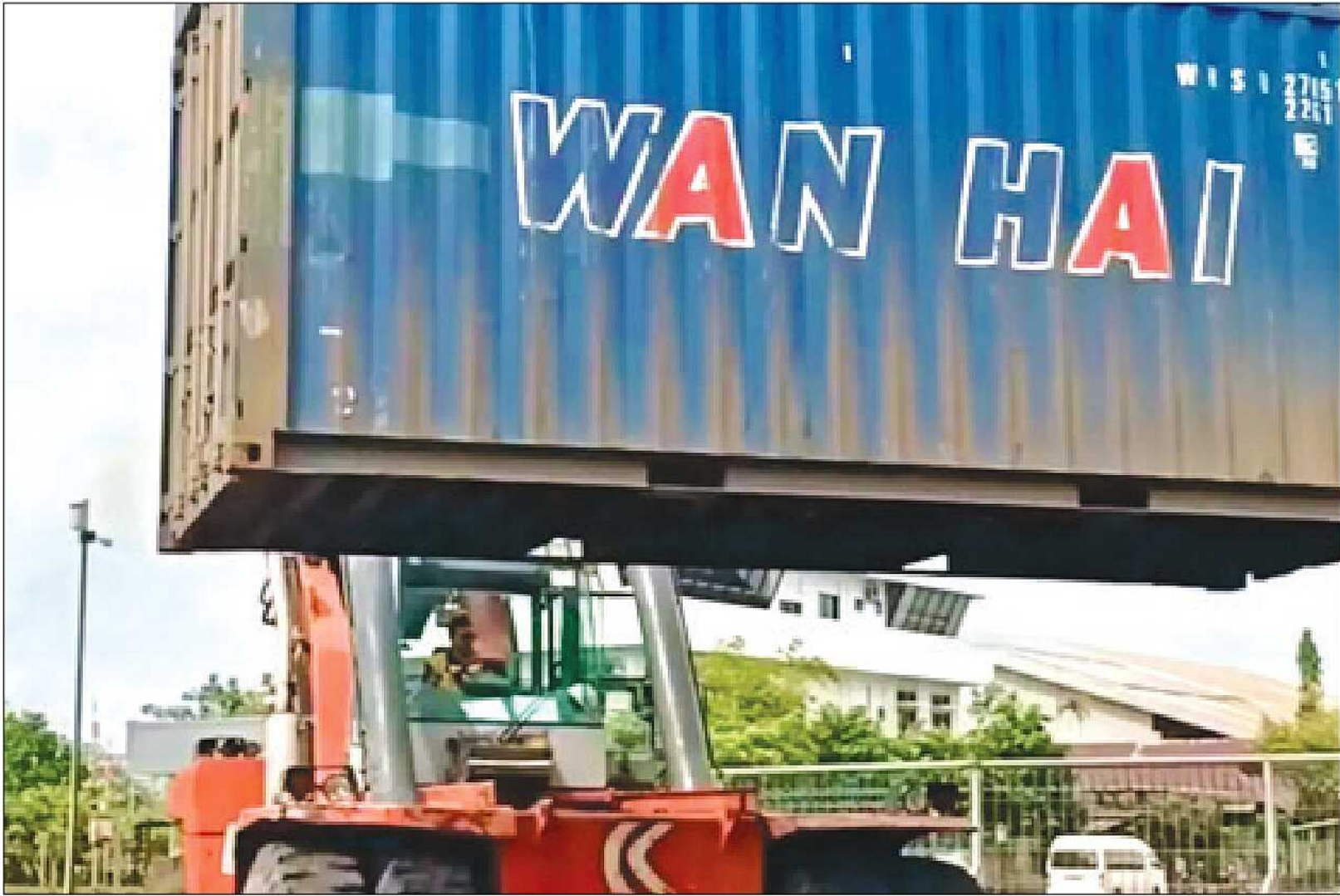
MENINGKAT. Nilai impor nonmigas Kalimantan Timur pada April 2026 meningkat signifikan.

tribusi 29,42 persen terhadap total impor nonmigas Kaltim. Sementara itu, negara-negara Uni Eropa mencatat nilai impor sebesar USD53,99 juta dengan kontribusi 18,10 persen. Data tersebut menunjukkan kawasan Asia Tenggara masih menjadi mitra dagang utama Kalimantan Timur dalam memenuhi kebutuhan bahan baku, barang penolong, maupun komoditas impor lainnya. (kpg/beb)