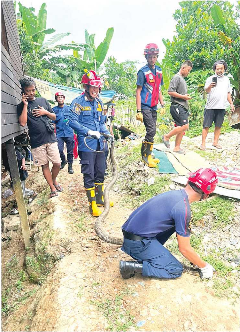
BERHASIL DIEVAKUASI. Petugas Damkar Samarinda mengevakuasi seekor ular king kobra sepanjang sekitar empat meter yang ditemukan di kawasan permukiman warga di Jalan Batu Cermin, Kelurahan Sempaja Utara.

Proses evakuasi berlangsung mulai pukul 10.00 hingga 10.40 Wita. Ular yang berhasil diamankan selanjutnya