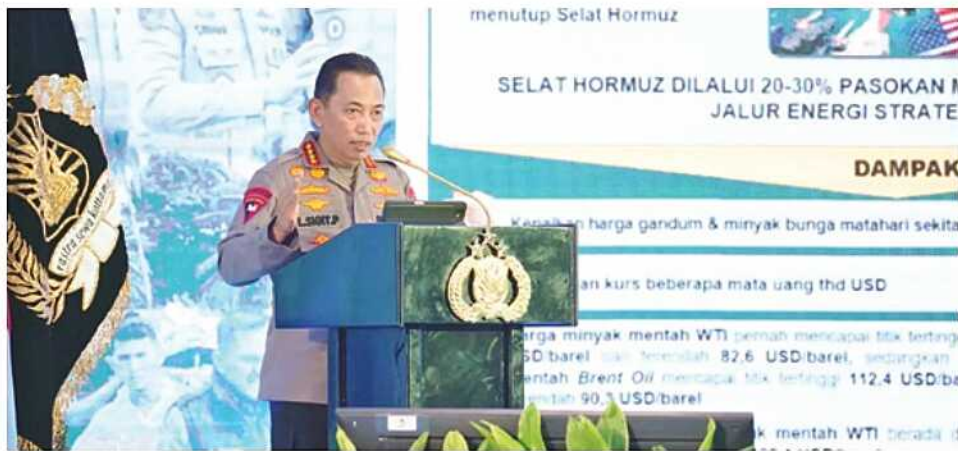
BERI SAMBUTAN. Kapolri Listyo Sigit Prabowo saat membuka Rapat Kerja Teknis Reserse Kriminal di Aula Bareskrim Polri, Jakarta Selatan.

"Jadi karena aktivis-aktivis akhirnya kosong, ya saya