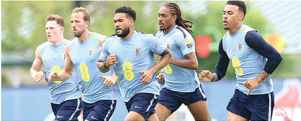
PATUT WASPADA. Timnas Inggris bakal menjalani persiapan di Kansas City, Missouri, Amerika Serikat, tempat tak jauh dari kasus penembakan terjadi pada Sabtu dini hari lalu.

sangka yang ditangkap. Polisi masih melakukan penyelidikan dan meningkatkan patroli di sekitar lokasi kejadian guna menjaga keamanan kawasan tersebut.