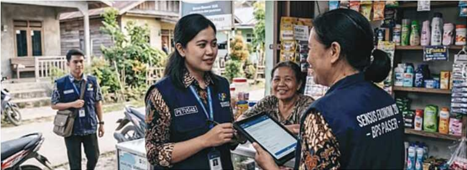
PENDATAAN. Petugas BPS Paser mengikuti pelatihan teknis sebagai persiapan pelaksanaan Sensus Ekonomi 2026 yang akan dimulai pertengahan Juni.

Jangan sampai tidak ada titipan dari DPRD, tetapi justru muncul dari pihak-pihak lain yang tidak terawasi," pungkasnya. (*/kpg/beb)