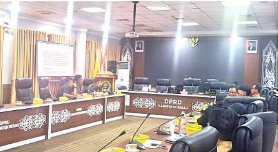
POLEMIK. Komisi II DPRD Berau menggelar rapat dengar pendapat bersama instansi terkait dan perwakilan masyarakat untuk menyamakan persepsi mengenai skema perhitungan BPHTB. Hasilnya, tiga poin kesepakatan baru ditetapkan dan akan mulai berlaku pada 15 Juni 2026.

Pemanfaatan embung di Kampung Payung-Payung kembali tertunda. Pemerintah masih membutuhkan anggaran hingga Rp25 miliar untuk melengkapi sistem pendukung agar fasilitas tersebut dapat berfungsi optimal.