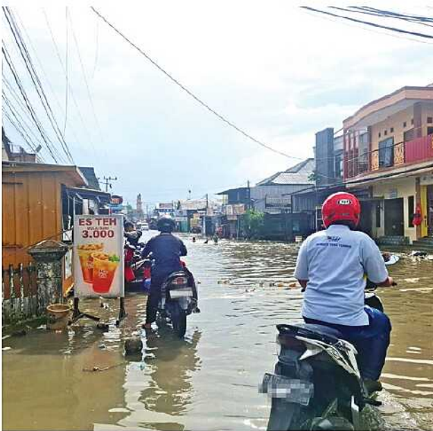
BANJIR DALAM. Genangan air merendam Jalan Pramuka ujung hingga mencapai sekitar 50 sentimeter saat hujan deras mengguyur Kota Samarinda, Senin (8/6). Kondisi tersebut membuat kendaraan roda dua kesulitan melintas.

"Alhamdulillah sudah ada pembenahan dan normalisasi secara bertahap. Biasanya genangan sekarang tidak bertahan terlalu lama," pungkasnya. (rin/beb)