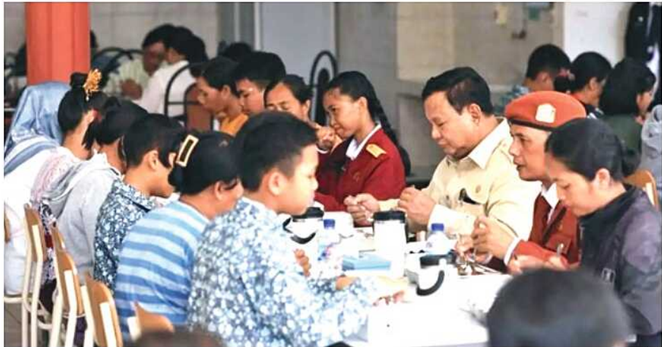
NIKMATI MAKANAN. Presiden Prabowo Subianto menikmati makan siang bersama para siswa Sekolah Rakyat Menengah Pertama (SRMP) 17 Tabanan, Bali.

pok masyarakat yang selama ini menghadapi berbagai keterbatasan. "Memang Sekolah Rakyat kita wujudkan untuk membantu mereka yang paling susah, mereka yang paling kurang berdaya," ujar Prabowo. Dalam kesempatan tersebut, Presiden juga menyoroti tingginya antusiasme masyarakat terhadap program Sekolah Rakyat. Berdasar laporan yang diterimanya, jumlah pendaftar di SRMP 17 Tabanan telah mencapai sekitar 400 siswa. Sementara kapasitas sekolah saat ini baru sekitar 270 siswa.